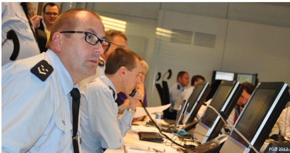
Crisiscentrum van de Luxemburgse politie, n.a.v.de huwelijksfestiviteiten van de toekomstige groothertog van Luxemburg in oktober 2012.

Verantwoordelijke uitgever Dr. J.P.R.M. van Laarhoven Secretariaat-Generaal Benelux Regentschapsstraat 39 1000 Brussel info@benelux.int www.benelux.int