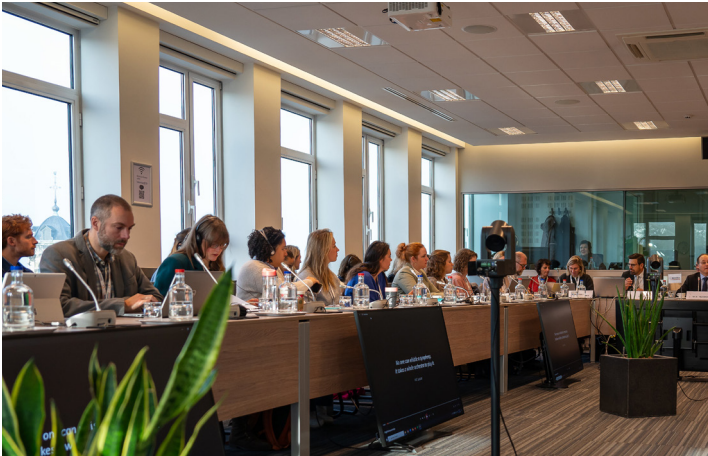
Benelux-conferentie over crisiscommunicatie in Steden - 13 november