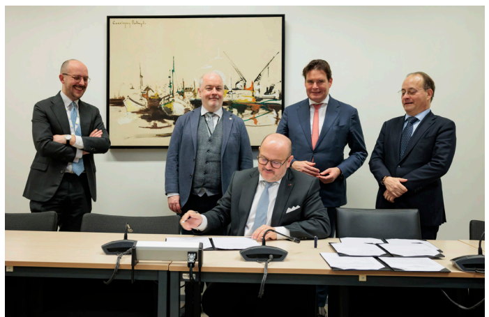
Comité van Ministers - 19 december