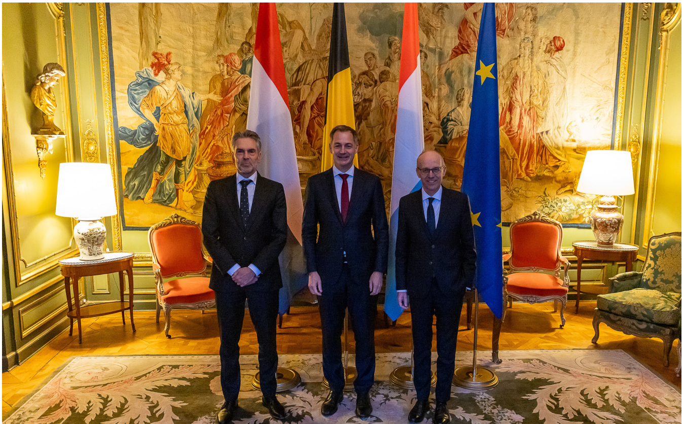
Benelux-top - 26 november